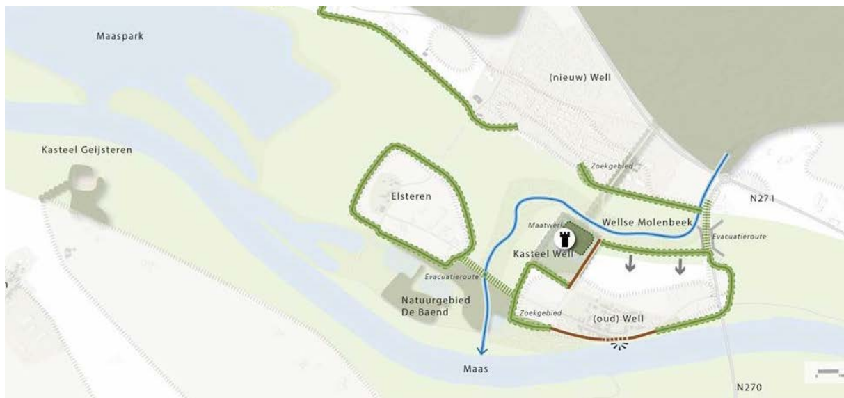
De oorspronkelijke variant: dijkaanleg en dijkverbetering

Deze vergravingen zijn zo gesitueerd en vormgegeven dat ze een basis vormen voor waardevolle natuurontwikkeling en ze passen in de karakteristiek van het landschap. Deze integrale variant heeft ook als voordeel dat in dit gebied de schop maar een keer de grond in hoeft, omdat rivierverruiming in de tijd naar voren geschoven is. Bovendien is de integrale variant 13% goedkoper dan de oorspronkelijke variant.