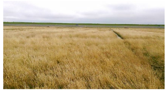
Begroeide kwelder bij Uithuizen, april 2015