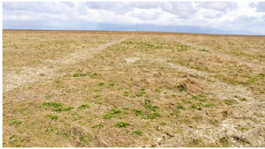
Kwelder na de winter Noord Friesland-buitendijks (stoppelveld), april 2017