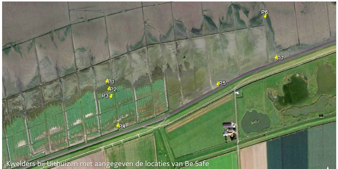
Kwelders bij Uithuizen met aangegeven de locaties van Be Safe

Een hoog en breed voorland of kwelder dempt de golven en vermindert daarmee de belasting op de dijk. Wanneer dit voorland begroeid is en dus ruw, is dit effect nog groter. Dit effect kun je meenemen bij het ontwerp van een dijkversterking. Dit kan de omvang van de versterking verminderen of misschien is versterking dan zelfs helemaal niet meer nodig.